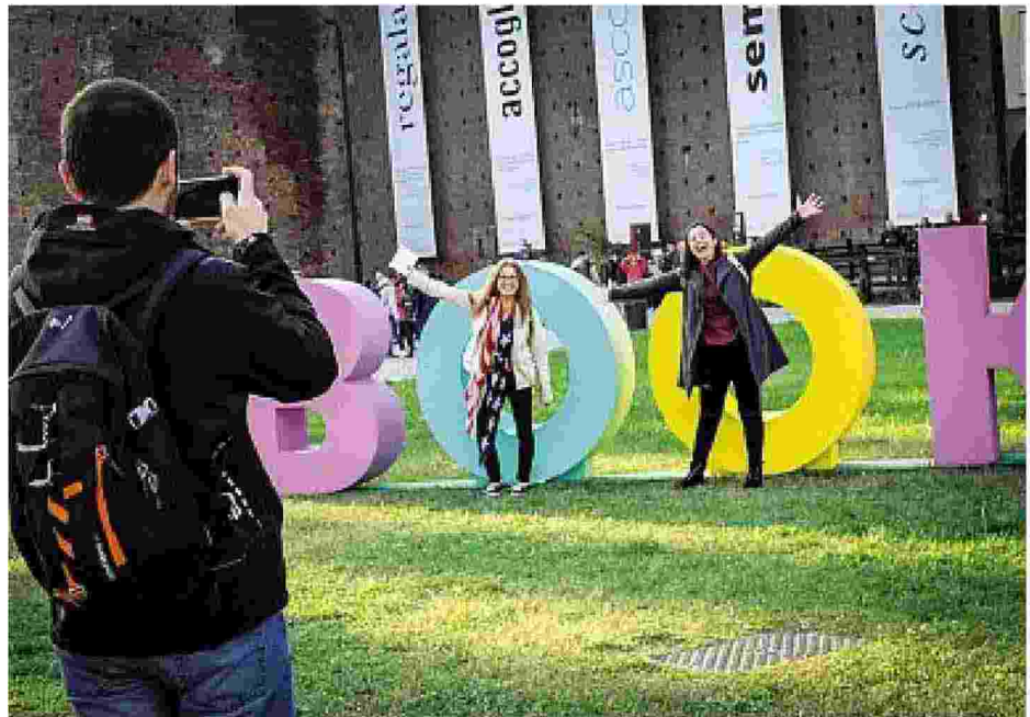
Un'immagine dell'edizione 2018 di BookCity al Castello Sforzesco di Milano

L'edizione nasce all'insegna dell'inclusione e dell'apertura, a partire dall'evento inaugurale che si intitola Convivenze e prevede la consegna del Sigillo della città a Fernando Aramburu, il 13 novembre al Teatro Dal Verme, con il dialogo dell'autore spagnolo con Paolo Giordano, la lectio di Michela Marzano e la poesia di Simone Savigin. Proprio alla poesia e al suo incontro con le arti sarà dedicato un al-